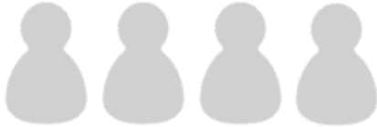
실험 프로젝트 참여자들