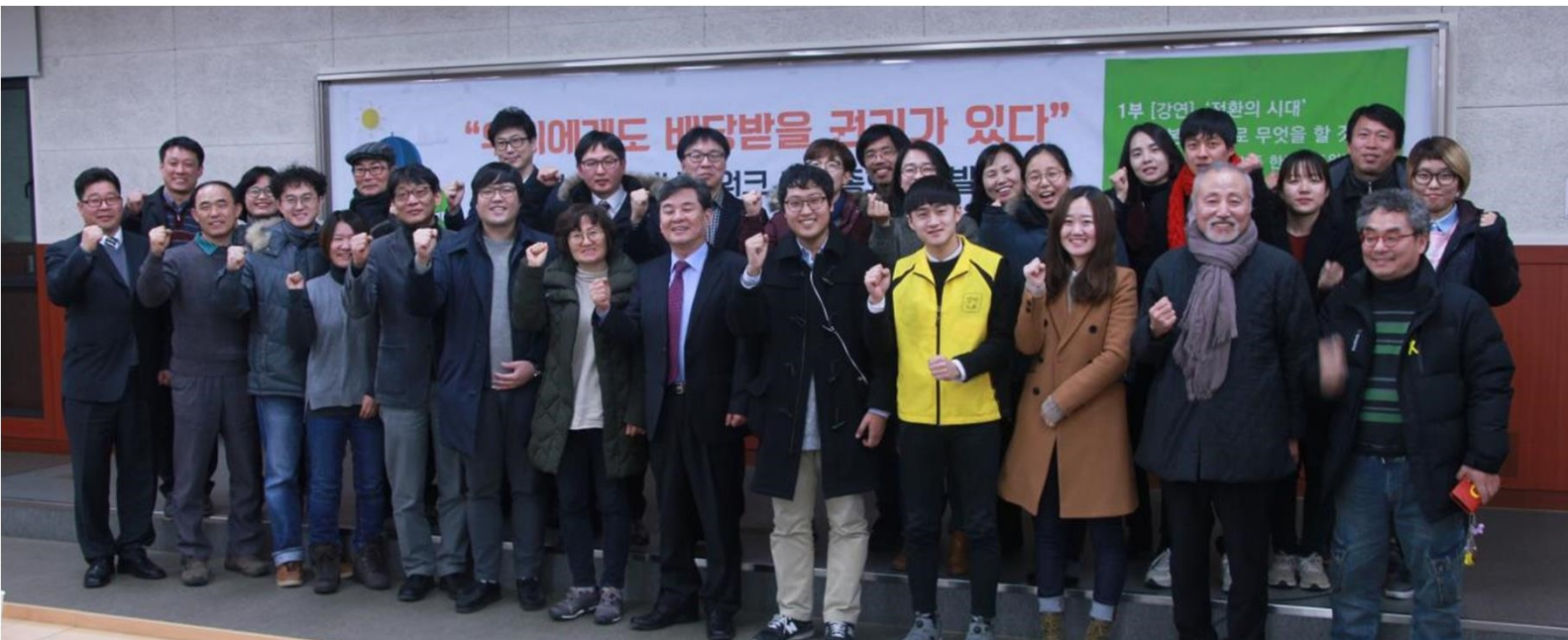
기본소득 전북네트워크 창립 총회 2017.2.10