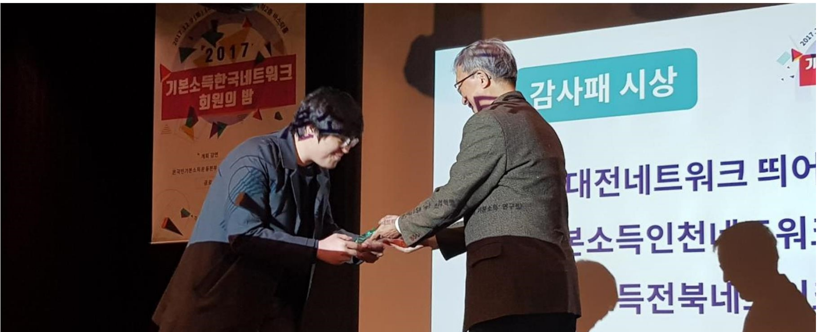
기본소득 한국네트워크 감사패 수상 2017.12.9